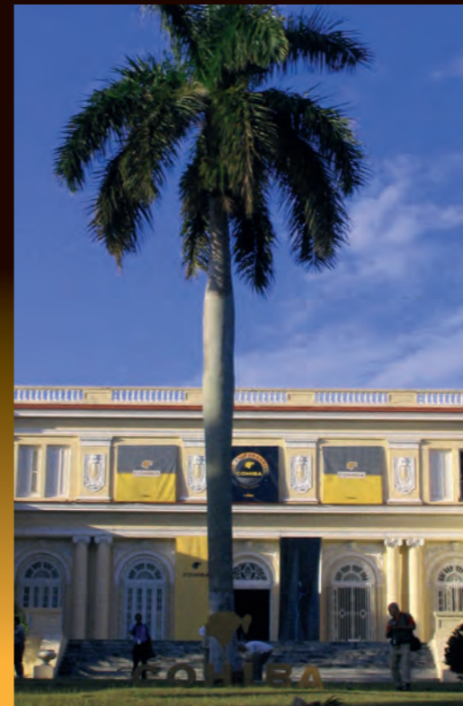
COHIBA Cigarren-Manufaktur „EL Laguito“ in Havanna

1964, an einem der letzten Abende des Jahres, lag Fidel Cigarre rauchend in einer Hängematte und überlegte. Chicho war in seiner Nähe. Plötzlich brach Fidel das Schweigen und