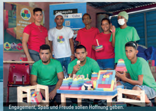
Engagement, Spaß und Freude sollen Hoffnung geben.

Camaquito e.V. ist seit 25 Jahren vor Ort und die Hilfe ist gerade jetzt ganz besonders gefragt. Denn in Santiago de Cuba sind zwei Blutgas-Analysegeräte im Einsatz, die für dringend notwendige Untersuchungen gebraucht werden. Lebenswichtige Diagnosen müssen weiter möglich bleiben. Das dazugehörige Verbrauchsmaterial ist inzwischen aufgebraucht. Nur durch Spenden ist es möglich, diese Geräte weiter zu betreiben.